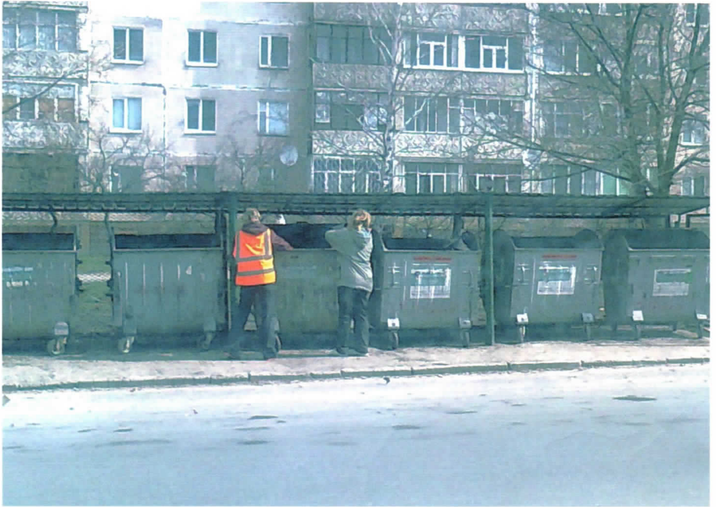
ул. Интернационалистов, 23