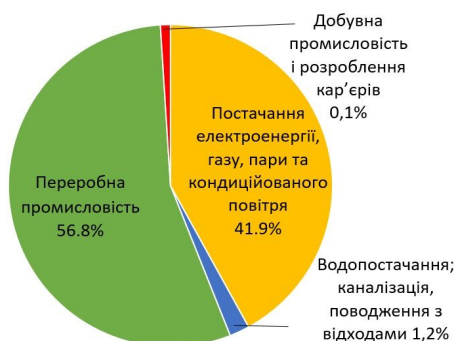
Мал. 3: Обсяг реалізованої промислової продукції за видами економічної діяльності у % до всієї реалізованої продукції у січні-квітні 2019 року

машин і устаткування; з виробництва гумових і пластмасових виробів, іншої неметалевої мінеральної продукції. На другому місці за обсягами реалізованої продукції підприємства постачання електроенергії, газу, пари та кондиційованого повітря (41,9 %).